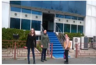
În fața hotelului