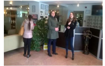
Așteptând un reprezentant