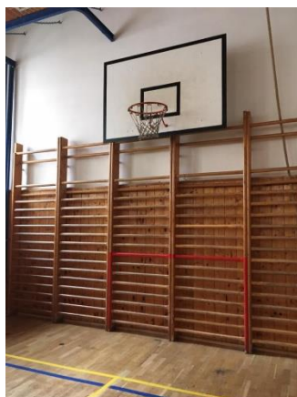
Sala de sport