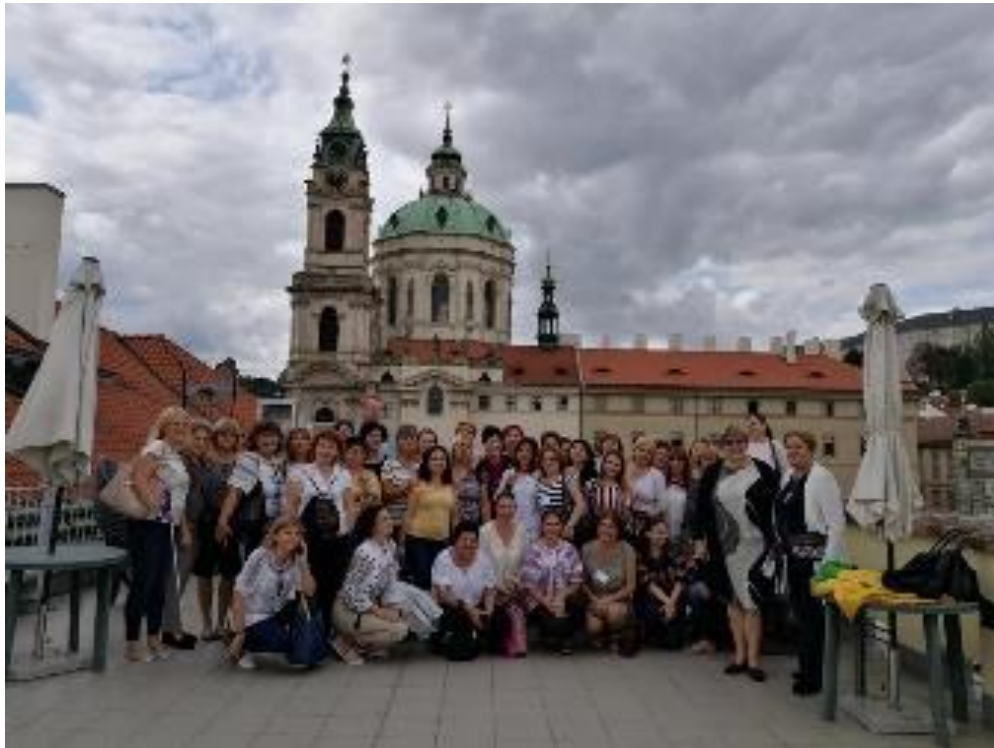
Photo on the roof of the school where there are activities and regular hours left

Foto de pe acoperișul școlii unde de altfel, se țin ore